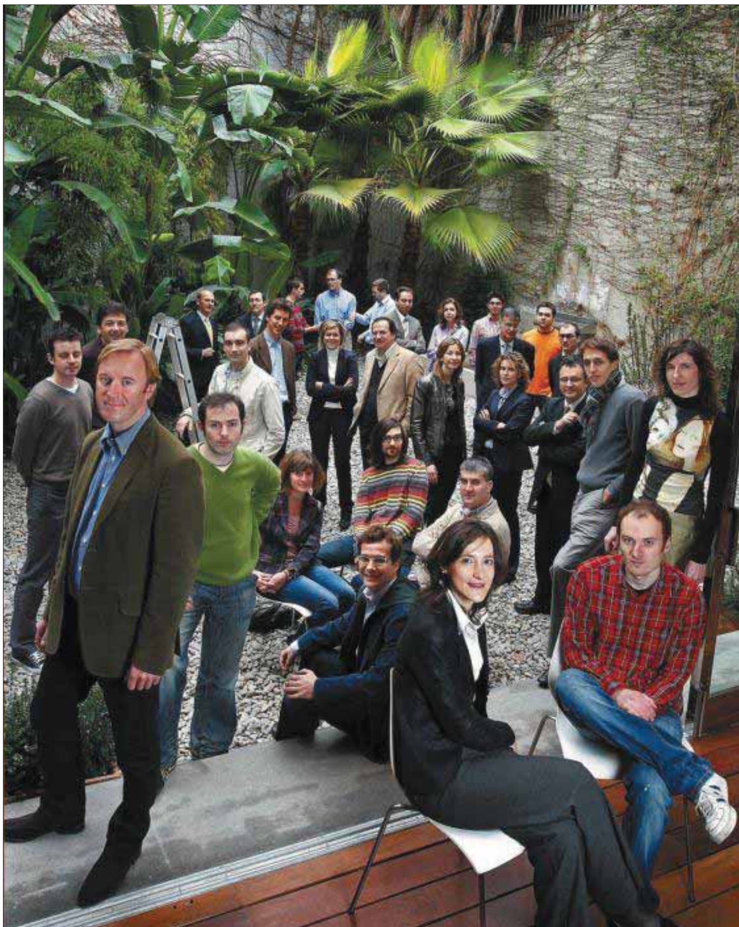
Concentración de inversores y emprendedores en la nueva librería Bertrand de Barcelona.